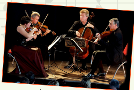
Le Quatuor Prazak