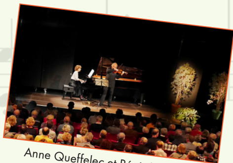
Anne Queffelec et Régis Pasquier