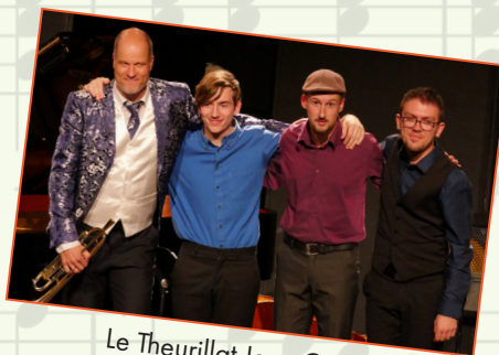
Le Theurillat Jazz Quartet