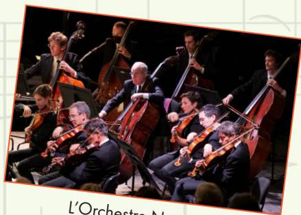
L'Orchestre National des Pays de la Loire